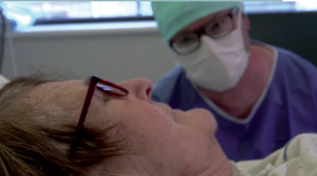
Extrait video Hypnose à l'hôpital

Film à visionner sur : fondation-apicil.org