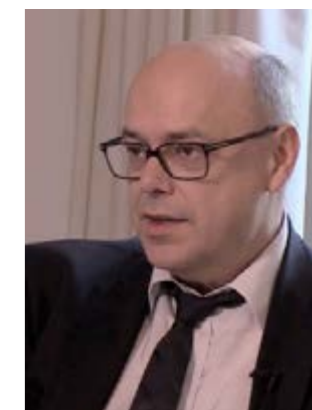
Pr Paul-Michel Mertes, Président du CFAR (CHRU Strasbourg)

En 2009, alors qu'en trois semaines, trois anesthésistes réanimateurs viennent de se suicider, le CFAR décide de créer la commission SMART (Santé des Médecins Anesthésistes Réanimateurs au Travail). Le SNIA, représentatif des Infirmières Anesthésistes, est associé à cette commission.